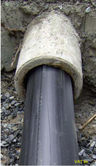
PE-rør i avløpsledningen: