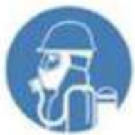
Åndedrettsvern eller friskluftsmaske